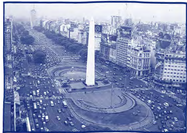
Y compará con la actualidad