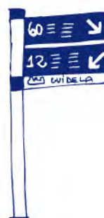
Parada de colectivo