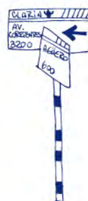
Carteles de las calles