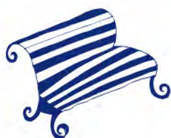
Asiento de plaza