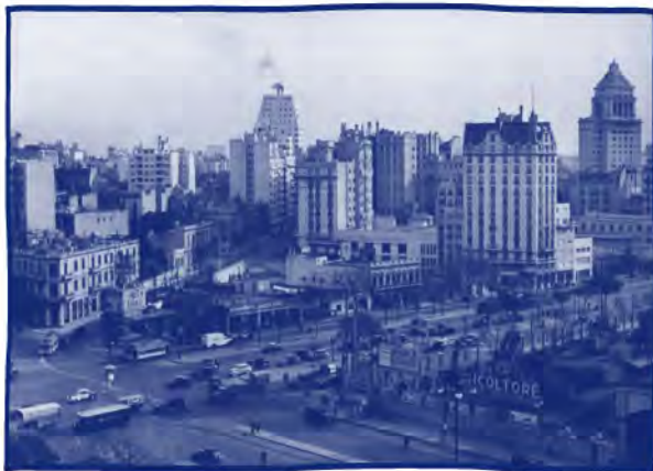
Mirá cómo se veía todo, allá por el... 1950

Te invitamos a imaginar la ciudad en la época de tus abuelos. Se parece a la ciudad de hoy, pero la velocidad es otra, es más lenta. Se están instalando los primeros semáforos, comienzan a construirse edificios más altos, clubes, mercados, estaciones de servicio y las plazas se ven decoradas con fuentes y estatuas. Todo crece... la cantidad de habitantes también.