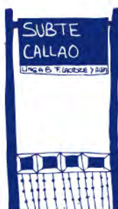
Entrada al subte